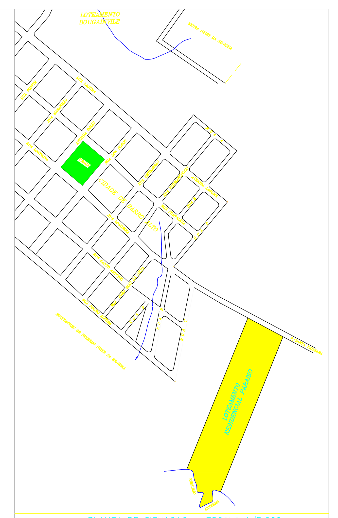
PLANTA DE SITUAÇÃO - ESCALA 1/5.000